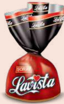
RED / KIRMIZI

Cream and crispy rice filled compound chocolate Krema dolgulu pirinç patlaklı kokolin الشوكولاته المركبة محشية بالكريمة والأرز المقرمش