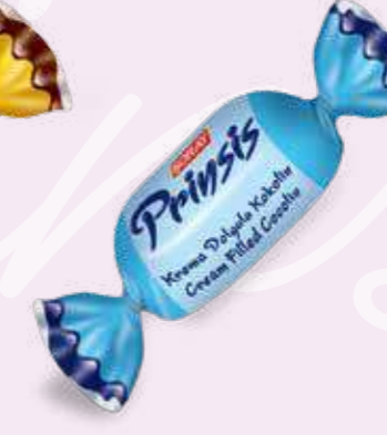
BLUE / MAVİ