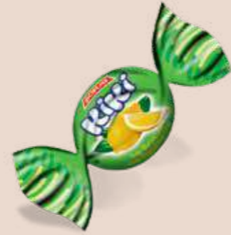
LEMON / LİMON