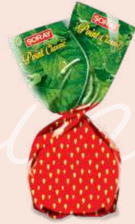
STRAWBERRY / ÇİLEK