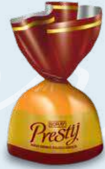
BROWN / KAHVERENGİ