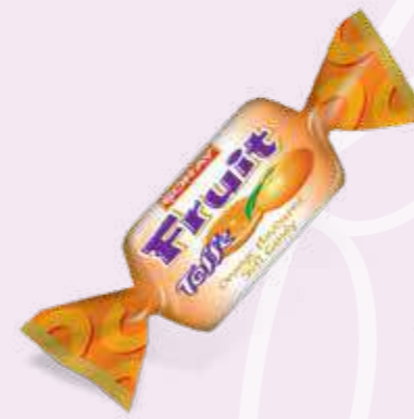
ORANGE / PORTAKAL

Fruit aromated soft candy Meyve aromalı yumuşak şeker سكاكر ناعمة بنكهات الفواكه