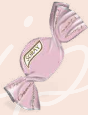
LILAC / LİLA