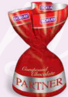
RED / KIRMIZI