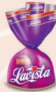
PURPLE / MOR