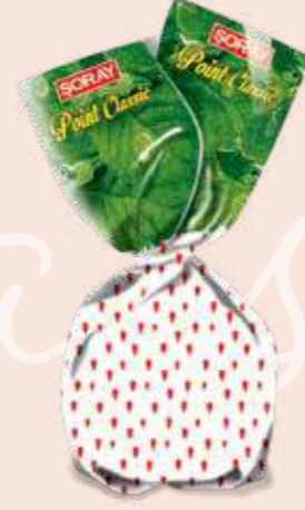
WHITE STRAWBERRY / ÇİLEK