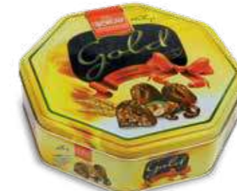
GOLD OCTAGON TIN BOX

Gramaj / Weight / الوزن K. İçi Adet / Units Pack / عدد 600 g 8