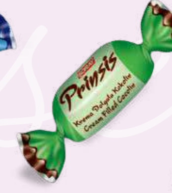
GREEN / YEŞİL