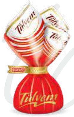
RED / KIRMIZI

Cream and crispy rice filled compound chocolate Krema dolgulu pirinç patlaklı kokolin الشوكولاته المركبة محشية بالكريمة والأرز المقرمش