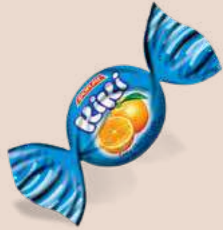
ORANGE / PORTAKAL