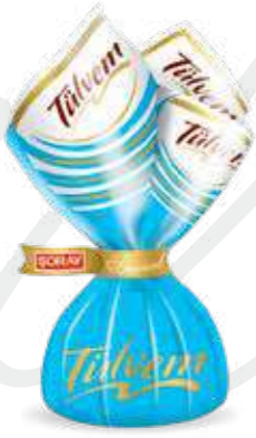
BLUE / MAVİ