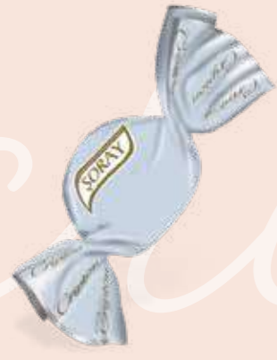
BLUE / MAVİ

Cream filled compound chocolate Krema dolgulu kokolin الشوكولاته المركبة محشية بالكريمة