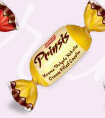
YELLOW / SARI