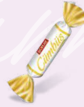
WHITE / BEYAZ