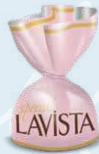
LILAC / LİLA