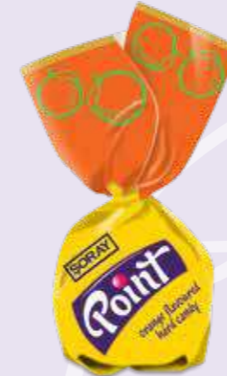
ORANGE / PORTAKAL