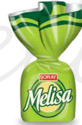
GREEN / YEŞİL