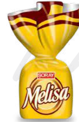
YELLOW / SARI