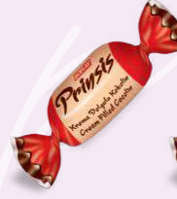
RED / KIRMIZI