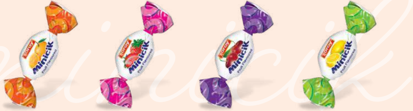
ORANGE / PORTAKAL

Fruit aromated hard candy Meyve aromalı sert şeker سكاكر صلبة بنكهات الفواكه