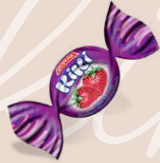
STRAWBERRY / ÇİLEK