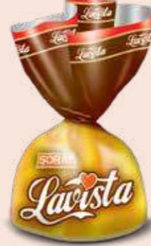
YELLOW / SARI