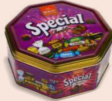
SPECIAL OCTAGON TIN

Gramaj / Weight / الوزن K. İçi Adet / Units Pack / عدد 500 g 8