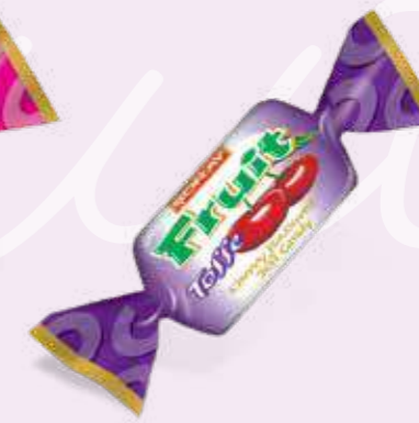
SOURCHERRY / VIŞNE