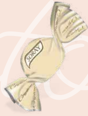
CREAM / KREM