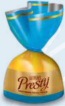
BLUE / MAVİ

Cream filled compound chocolate Krema dolgulu kokolin الشوكولاته المركبة محشية بالكرامة