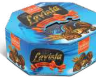
OCTAGON CARTON BOX

Gramaj / Weight / الوزن K. İçi Adet / Units Pack / عدد 1000 g 8