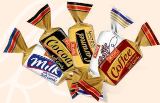
MIX / KARIŞIK