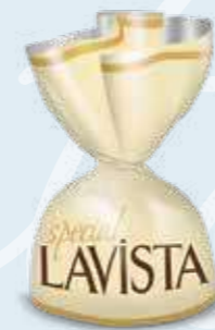
CREAM / KREM