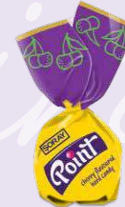
SOURCHERRY / VIŞNE