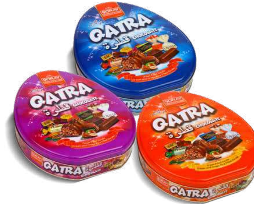
SPECIAL QATRA DROP TIN

Gramaj / Weight / الوزن K. İçi Adet / Units Pack / عدد 500 g 8