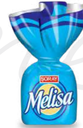
BLUE / MAVİ