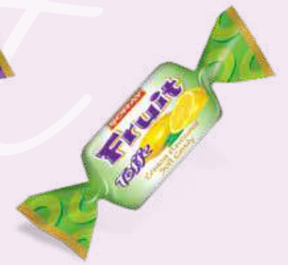
LEMON / LIMON