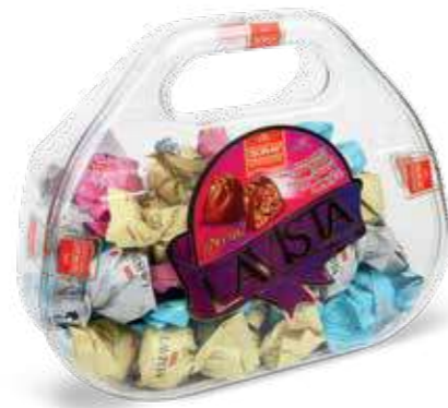
HAND BAG PVC

Gramaj / Weight / الوزن K. İçi Adet / Units Pack / عدد 2000 g 6