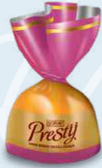
PINK / PEMBE