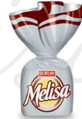
GREY / GRİ