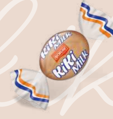
MILK / SÜT