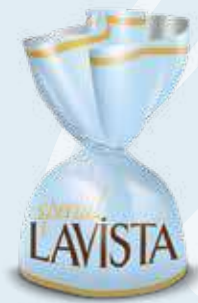
BLUE / MAVİ

Cream and crispy rice filled compound chocolate Krema dolgulu pirinç patlaklı kokolin الشوكولاته المركبة محشية بالكرامة والأرز المقرمش