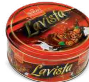
CYLINDER TIN BOX

Gramaj / Weight / الوزن K. İçi Adet / Units Pack / عدد 500 g 12