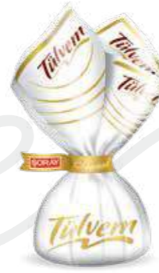
WHITE / BEYAZ