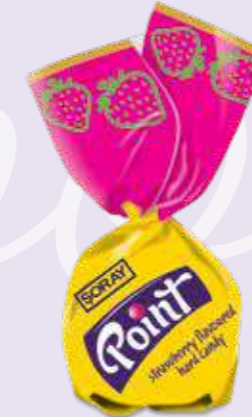
STRAWBERRY / ÇİLEK