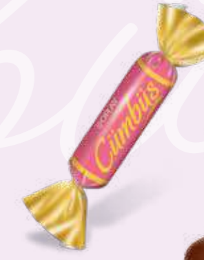
PINK / PEMBE