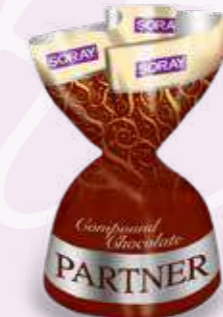
BROWN / KAHVERENGİ