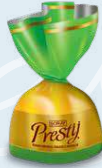
GREEN / YEŞİL