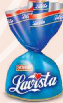
BLUE / MAVI