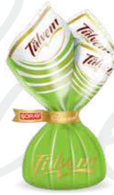
GREEN / YEŞİL