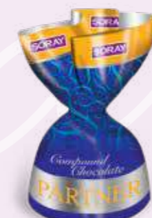
BLUE / MAVİ