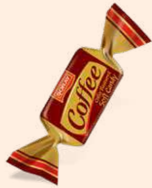
COFFEE / KAHVE