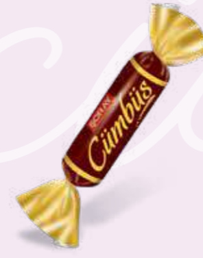
BROWN / KAHVERENGİ