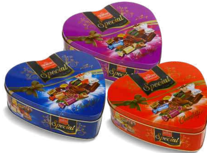
SPECIAL HEART TIN

Kodu / Code / رمز المنتج Renk Kodu / Colour Code / رمز اللون 8502 TX MIX