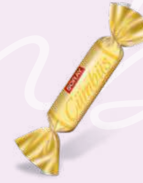
CREAM / KREM