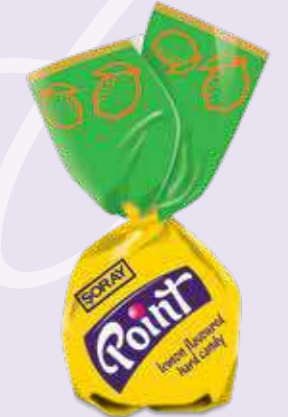
LEMON / LİMON