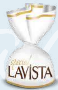
WHITE / BEYAZ