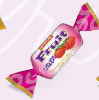
STRAWBERRY / ÇİLEK