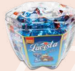
BELL PEPPER PVC

Kodu / Code / رمز المنتج Renk Kodu / Colour Code / رمز اللون 5004 PW A | B | C | G