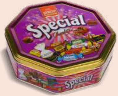
SPECIAL OCTAGON TIN

Cream and crispy rice filled compound chocolate Krema dolgulu pirinç patlaklı kokolin الشوكولاته المركبة محشية بالكريمة والأرز المقرمش