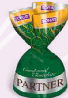
GREEN / YEŞİL