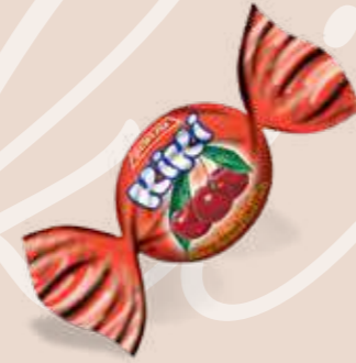
SOURCHERRY / VIŞNE